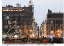
La escenografía luminosa que rodea el Zócalo y que estará encendida hasta el 5 de noviembre.

Brugada enciende Ofrenda Monumental en el Zócalo: Tradición, arte y comunidad para el Día de Muertos