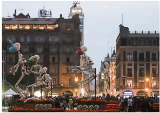
La escenografía luminosa que rodea el Zócalo y que estará encendida hasta el 5 de noviembre.

La ofrenda se considera un símbolo de la riqueza cultural de la CDMX