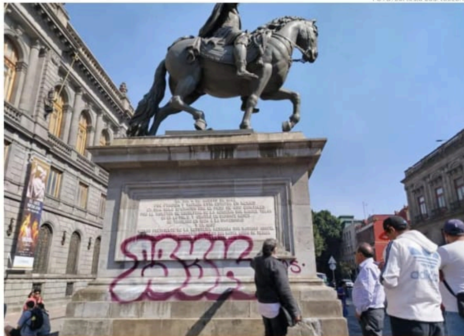
LIMPIANDO A "EL CABALLITO"

Trabajadores de la Secretaría de Cultura de la Ciudad de México en coordinación con la Secretaría de Obras y Servicios (SOBSE), bajo la supervisión del Instituto Nacional de Antropología e Historia (INAH), llevan a cabo trabajos de limpieza del pedestal de la "Estatua Ecuestre de Carlos IV", conocida como "El Caballito", ubicada en el Centro Histórico de la capital, que tenía múltiples graffitis en su superficie.