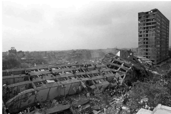
Dos de las fotografías de Marco Antonio Cruz que se exhiben en el MAF.