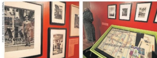
La muestra se conforma por más de 500 piezas como fotografías, revistas, vestuarios y objetos publicitarios.

Otros portales: el capitalino | animalpolitico | es-us.vida-estilo.yahoo |