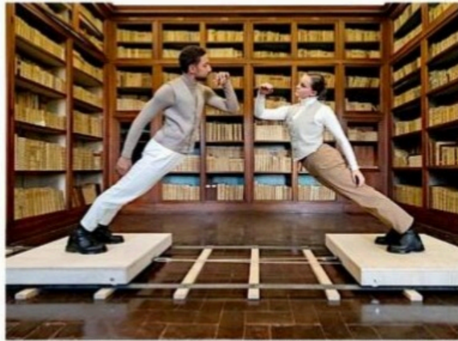
■ Noyollo Opus 52 , de Danza Visual, se presentará el próximo 10 de julio en el Teatro de la Ciudad.

"Empezamos a pensar en el amor, por 'noyollo', quisimos empezar con la palpitación y comenzamos a pensar en la rotación; de ahí surgen los vales, pero no queríamos vales que se pudieran