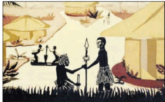
«Fotograma de la película Nyanga.»

los primeros borradores de los guiones, los procesos de filmación, hasta su estreno en distintos espacios de exhibición nacional e internacional. Hay que recordar que desde su creación en 2019, el Ecamc ha acompañado a cineastas indígenas y afrodescendientes de distintas regiones de México y Centroamérica para que, a través de sus películas, nuestro cine proyecte una mayor diversidad de historias. Con este estímulo se han apoyado los procesos de producción o postproducción de 68 películas (cortometrajes y largometrajes de ficción, documental y animación), realizados por 31 mujeres y 35 hombres de pueblos originarios y afrodescendientes de México y Centroamérica, así como de los mujeres mexicanas no indígenas. De las 68 películas se han terminado 12, de las cuales 11 ya han sido estrenadas en festivales de cine nacionales e internacionales.