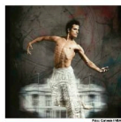
Celebra con cuatro estrenos La Compañía Nacional de Teatro experimenta con un trabajo "con una luz distinta que emana de su interior".