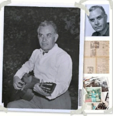
El Archivo Tamayo tiene la obra de José María de San Martín, el más importante pintor peruano del siglo XIX.

El Archivo Tamayo, agencia que custodia el legado del pintor peruano más importante del siglo XIX, busca un museo para albergar su colección digitalizada.