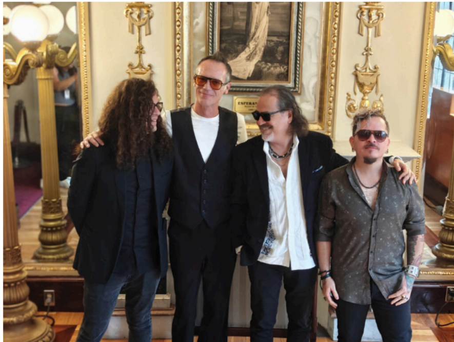
La Barranca presentará Antimateria en el Teatro de la Ciudad Esperanza Iris

Esperanza Iris el día 27 de septiembre. Además de la versión digital, como debe ser, habrá versión física con un vinilo, algo ya común con José Manuel Aguilera y compañía.