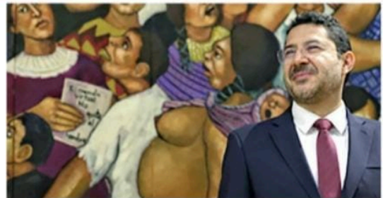
Una obra del muralista, Ariosto Otero

Destacó que el mural invita a todas las personas a despertar, "a volvernos nosotros mismos agentes de nuestra liberación, porque