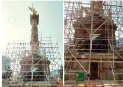
Las obras concluirán en dos o tres meses.

Ángel de la Independencia. De acuerdo con el plan de trabajo, informó ayer la Secretaría de Cultura federal en un comunicado, se prevé que esta etapa concluya en un plazo de dos a tres meses, gracias a la aportación de recursos federales. "El objetivo principal es consolidar y renovar los elementos que integran este emblema de la Ciudad de