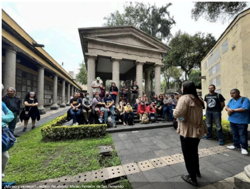
¿Museo y panteón?