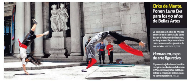
Cirko de Mente. Ponen Luna Eva para los 90 años de Bellas Artes

El líder de la gran coalición del gobierno federal, Manuel Delgado, anunció que la mayoría calificada en la próxima Legislatura de la Cámara de Diputados será de las clases medias y educadas, lo que le permitirá impulsar reformas importantes. Delgado afirmó que esta mayoría será el resultado de la participación activa de los ciudadanos en el proceso electoral. Además, mencionó que el gobierno federal seguirá trabajando en estrecha colaboración con los estados para mejorar la calidad de vida de los mexicanos.