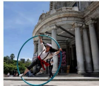
LLEGA EL CIRKO MENTE A BELLAS ARTES

El artículo de Landrau es una crítica a la actitud de la UNAM frente a la cultura y el arte. Landrau argumenta que la institución es demasiado conservadora y teme a cualquier cambio o innovación. Él cree que la UNAM debe ser más abierta y receptiva a las ideas nuevas y que debe ser un lugar donde se pueda aprender y crecer sin miedo.