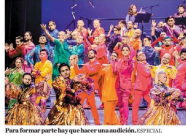
Para formar parte hay que hacer una audición. ESPECIAL