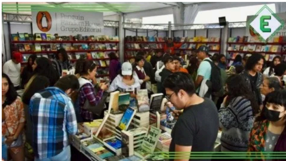
Feria del Libro Zócalo: Actividades del sábado 12 de octubre | X @FILZocalo

En esta edición de la Feria del libro del Zócalo 2024, la gente podrá encontrar todo tipo de contenido cultural y literatura de varios géneros, además de foros, donde las personas podrán disfrutar de presentaciones, charlas y debates que a continuación te presentaremos.