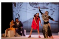
Una escena de 'Operas que crecen en el Teatro El Calero'.