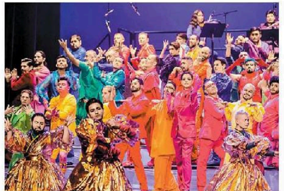
Para formar parte hay que hacer una audición. ESPECIAL