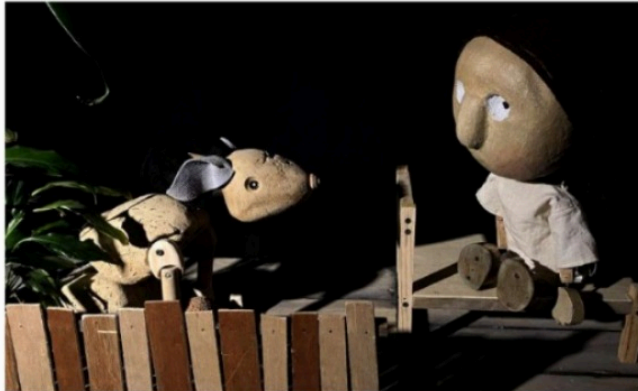
La pieza busca mostrar que el abuso se puede vivir desde la confianza, mediante la manipulación.