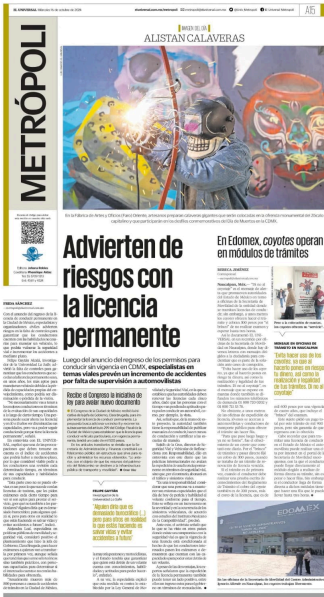
IMAGEN DEL DÍA ALISTAN CALAVERAS