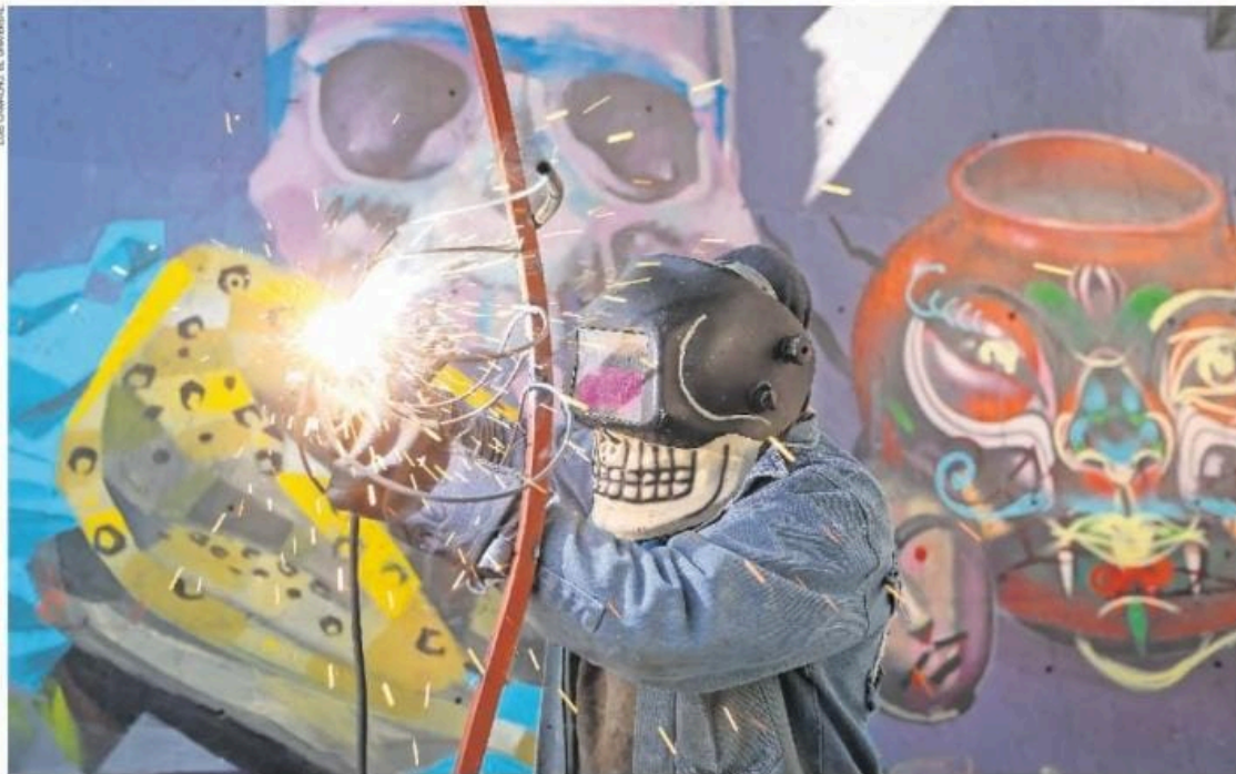
En la Fábrica de Artes y Oficios (Faro) Oriente, artesanos preparan calaveras gigantes que serán colocadas en la ofrenda monumental del Zócalo capitalino y que participarán en los desfiles conmemorativos del Día de Muertos en la CDMX.