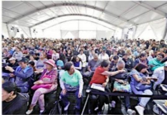
El Foro Elvia Carrillo Puerto de la Feria Internacional del Libro del Zócalo (FILZ), donde se llevó a cabo la presentación del nuevo libro de la escritora, lució abarrotado.

"Su literatura destila feminismo sensible y crítico que se aleja de la trampa esencial-