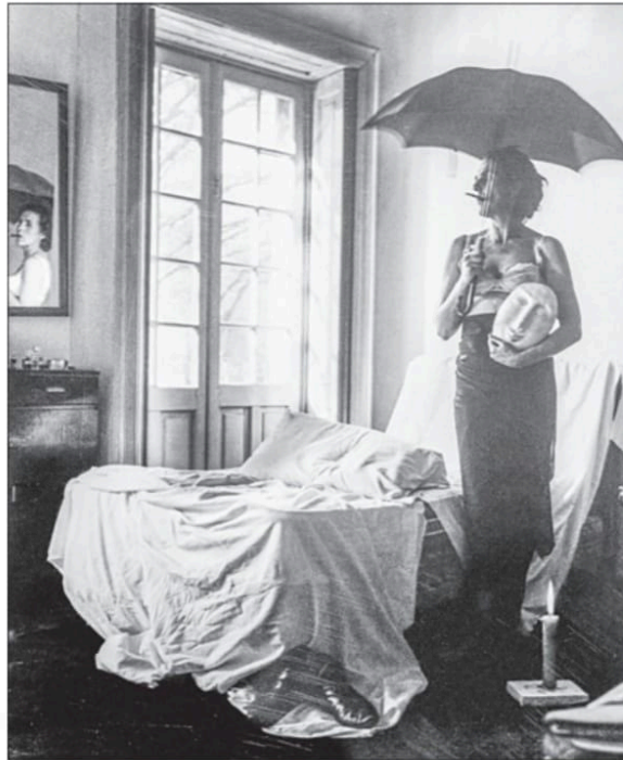
▲► Imágenes de artistas mexicanas se entrelazan con citas y retratos de la escritora Elena Poniatowska en la galería al aire libre, ubicada en la avenida Paseo de la Reforma. Arriba, instantánea de Kati Horna; abajo, la autora de La noche de Tlatelolco fotografiada por Rogelio Cuéllar y, a la vez, por Alondra Flores Soto.

Sonriente, con el gesto lleno de curiosidad ante cada imagen, leyendo las distintas citas enmarcadas junto a los retratos y fotografías contemporáneas, la ganadora del Premio Cervantes 2013 recorrió la