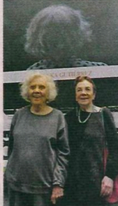
La escritora junto a Graciela Iturbide, fotógrafa, durante la apertura de la exposición.

El funcionario destacó el carácter contemporáneo de la obra de Poniatowska, quien ha reivindicado las creaciones artísticas y populares de México y cuya obra, dijo, ha abierto las puertas a quienes no tenían oportunidad de ser escuchados.