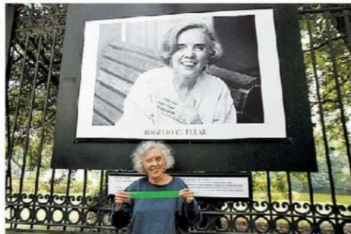
La muestra estará abierta hasta el 16 de septiembre.