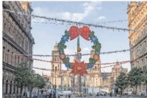
El 17 de diciembre se encenderá el tradicional alumbrado decorativo de los edificios de Gobierno, que enmarcará las distintas actividades en el Zócalo.

Entre las actividades que capitalinos y visitantes podrán disfrutar