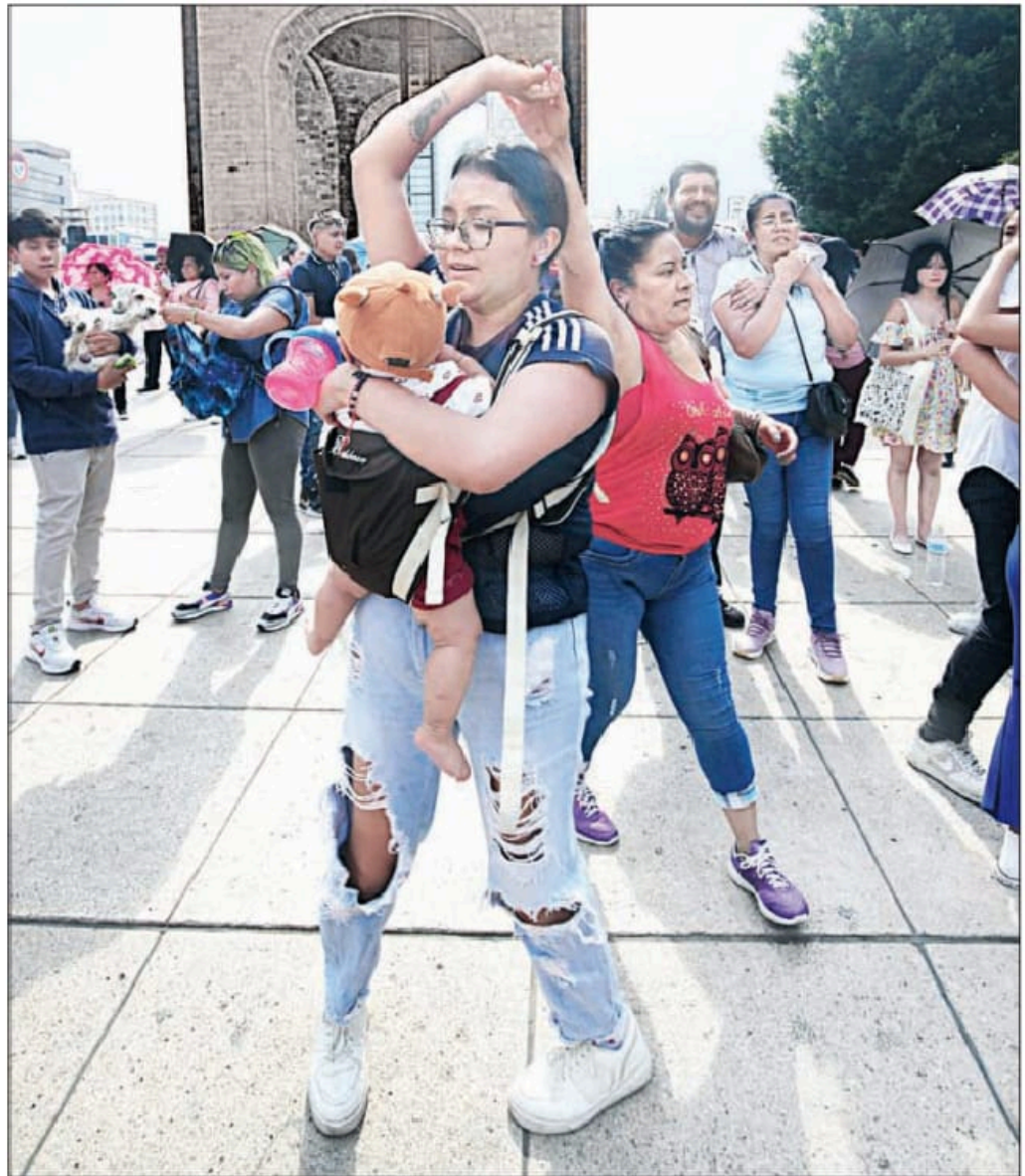
EN EL GRAN baile que organizó la Secretaría de Cultura de la Ciudad de México se celebró a las madres me xicanas en el Monumento a la Revolución, donde sonó y resonó la cumbia por todos los rincones de la Plaza de la República y se reuró "la gente changona", como describió Emir Pabón, cantante del grupo Cañaveral a los asistentes en