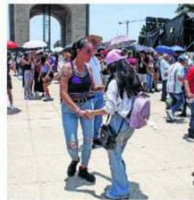
El grupo animó los alrededores de Revolución, que se convirtieron en una gran plaza de baile, en el que las familias festejaron a sus madres.