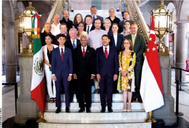
VALORACIÓN. El jefe de Gobierno, Martí Batres, explicó que el Comité Organizador tomó en cuenta las políticas sociales, de movilidad, innovación tecnológica y estrategias de protección al medio ambiente.

Celebró que la Ciudad se integra a la lista de urbes premiadas desde 2010, que son: Bilbao, España; Nueva York, Estados Unidos; Suzhou, China; Medellín, Colombia; Seúl, Corea del Sur y Viena, Austria.