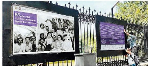
Se presentan diversos momentos, como la Segunda República.