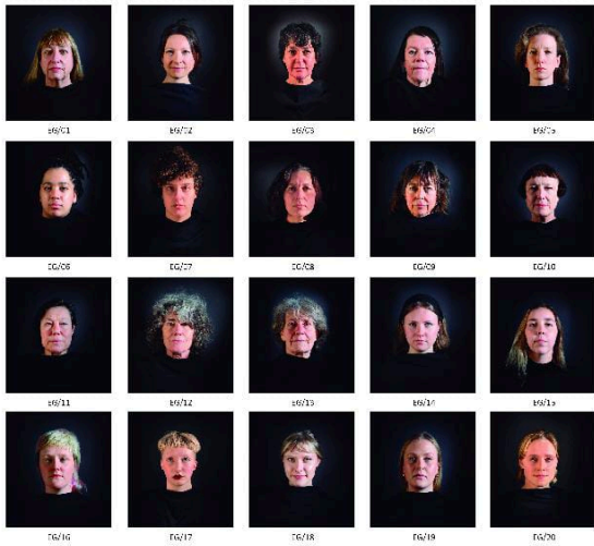
Face to Face for México (2024) es el estreno de la obra en su forma mejorada y ampliada, después de las versiones de Dublín, Kioto, Trento, Bogotá y Manchester.

Aunque reconoce que "Nunca es fácil responder por el artista algunas de las preguntas que se plantean sobre una obra", la voz y la mirada del curador colombiano Santiago Gardeazábal es lo más cercano al pensamiento del compositor, escritor, productor, artista visual y productor musical inglés Brian Eno, cuya instalación Face to Face for México llega a nuestro país a través de El Aleph. Festival de Arte y Ciencia, en un proyecto artístico con Inteligencia Artificial que se inaugura esta noche en la Capilla del Colegio de San Ildefonso con rostros de mujeres. "Lo que se va a ver en México no es lo que se vio en Trieste, no es lo que se vio en Manchester, no es lo que se vio en Bogotá, es una versión específica ideada para el Colegio de San Ildefonso en el marco de este festival", afirma Santiago Gardeazábal en entrevista, en la que señala que Eno quiso que se expusieran sólo rostros de mujeres, contrario a otros países donde ha expuesto. Cuenta que la versión de Bogotá, que también curó para el Centro Nacional de las Artes, en 2023, se propuso una versión con rostros humanos tanto de hombres como de mujeres dentro de una sala que es una caña negra que está seis pisos bajo tierra, pero para el Colegio de San Ildefonso, Brian Eno y su equipo decidieron solamente hacer una pantalla en la que únicamente habrá rostros femeninos. "Eso es particular, yo me lo cuestiono y respondo que exponer esta obra en San Ildefonso con ese peso y valor cultural tan impresionante