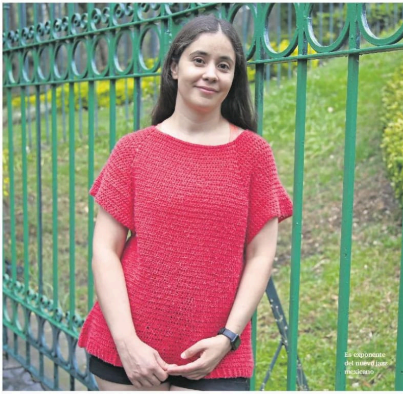
Es exponente del nuevo jazz mexicano