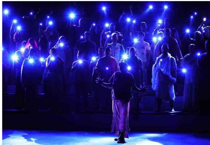
El Coro Gay Ciudad De México Presenta Nubes Malva En El Teatro De La Ciudad Esperanza Iris