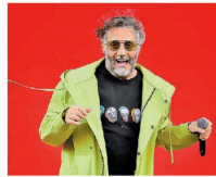
Lamentó no estar en la capital. ARIELO JEDDA

México se preparaba para recibirlo para un concierto masivo en el Zócalo de la capital, donde se han presentado diversos artistas como Paul McCartney, Roger Waters, Ca-