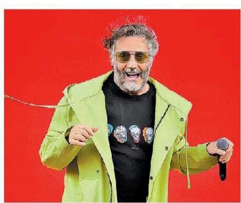
Lamentó no estar en la capital. ARIELO JEDDA

El escritor Páez ha incursionado en la literatura; algunos libros de sus libros son La puta diablo , Diario de viaje y Los días de Kirchner .