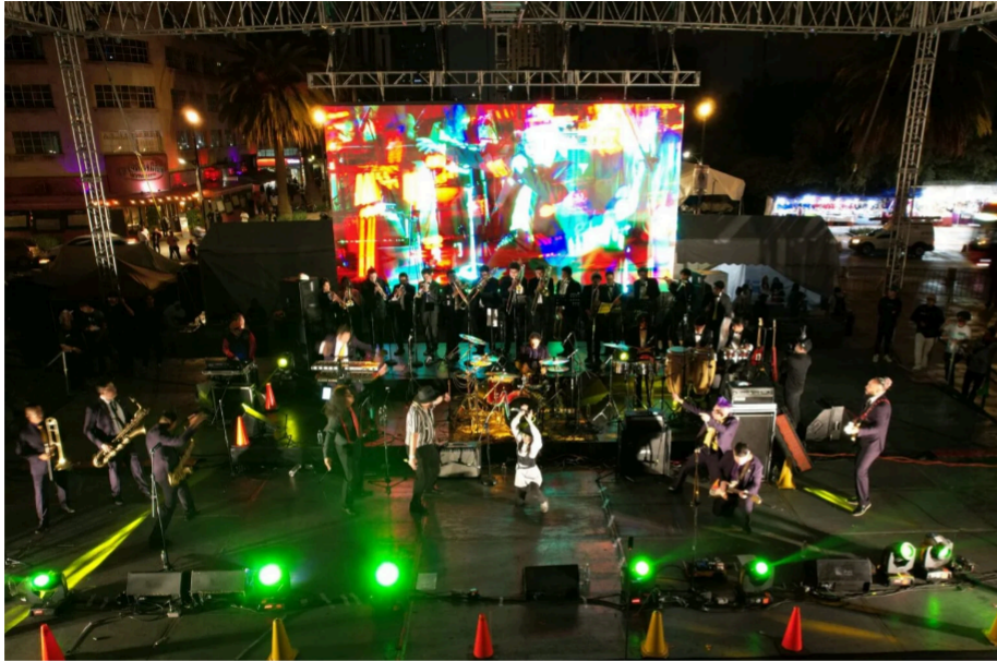
Presentan talentos musicales del Festival Jóvenes por la Paz Volumen 2