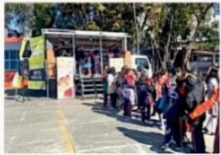
Las unidades de RTP donadas serán integradas a la flota del programa Librobús en Tu Escuela.