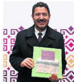
El jefe de Gobierno, Martí Batres, compartió la felicidad de leer y recomendó algunos títulos.

El jefe de Gobierno, Martí Batres, recomendó algunos libros como El hombre que amaba a los perros , de Leonardo Padura; Las edades de Lulú , de Almudena Grandes; La inso-