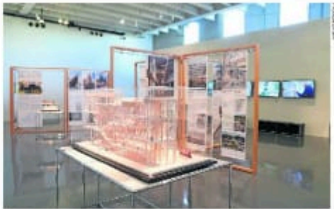
El festival incluirá siete exposiciones.