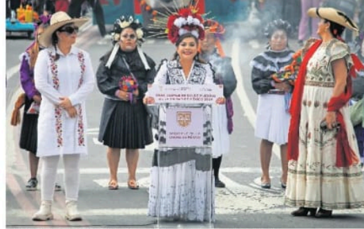
La jefa de Gobierno de la CDMX, Clara Brugada, dio el banderazo de salida del desfile.