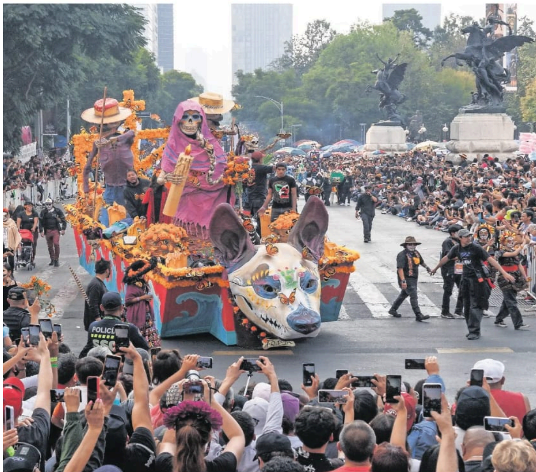
Miles de capitalinos y turistas disfrutaron los diferentes carros alegóricos que a partir de las 14:00 horas de este sábado recorrieron Paseo de la Reforma, desde el Ángel de la Independencia hasta el Zócalo.