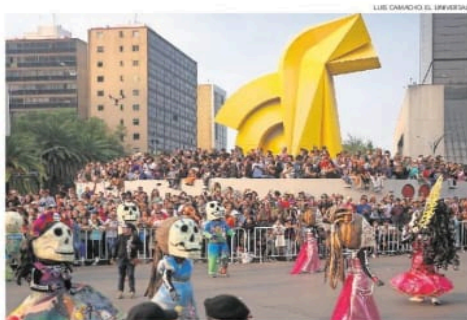
Cientos de personas se instalaron en la fuente de Reforma y avenida Juárez para tener un mejor lugar y así observar el paso de los carros alegóricos.