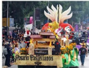
En el Gran Desfile de Día de Muertos de este año participaron 71 carros y 7 alegóricos.

De acuerdo con el Gobierno capitalino, el evento reunió a más de un millón 300 mil espectadores, además de 6 mil voluntarios, entre ellos 600 extras y catrines, así como ajolotes, diablos, mariachis y dioses prehispánicos que avanza-