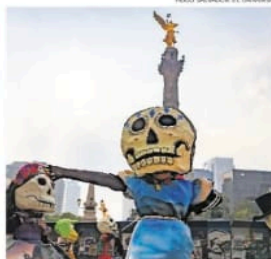
Gran variedad de cabezas decoraron a los miles de asistentes al Desfile del Día de Muertos.