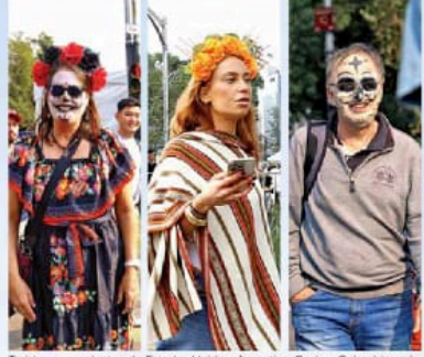
Turistas provenientes de Estados Unidos, Argentina, Rusia y Colombia, así como de otras entidades del país se unieron al desfile.

Entre los edificios de esta icónica avenida, resonaron estrofas como "Tápame con tu reboso, Llorona, porque me muero de frío", que deleitaron a un millón 300 mil asistentes.