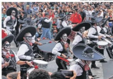
Atacidos como maracas y sonajillos como Carreras así participó un grupo de músicos con sus tambores.