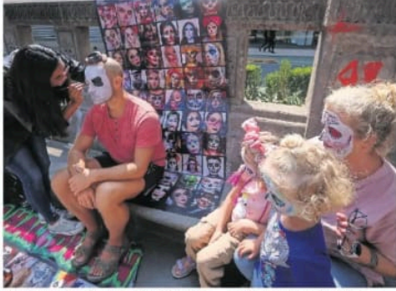
Maquillistas se instalaron sobre Paseo de la Reforma para ofrecer sus servicios y entre sus clientes estuvieron turistas internacionales.