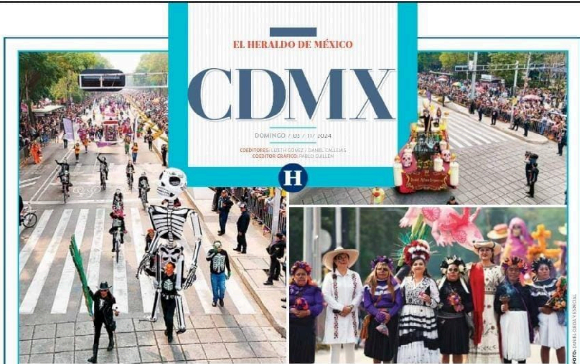
• ATRACTIVO. Capitalinas y capitalinos, visitantes de otras entidades del país y del extranjero, abarrotaron los ocho kilómetros de la ruta.

E l Gran Desfile de Día de Muertos 2024 de la Ciudad de México rompió récord de asistencia al reunir a un millón 300 mil personas, 50 mil más que el año anterior. Al dar el banderazo de salida en el recorrido, la jefa de Gobierno, Clara Brugada, destacó que el evento condensa la riqueza cultural del país. "Aquí en el centro de México, celebramos a nuestros muertos con este gran desfile que condensa la riqueza cultural del país. Aquí con este desfile celebramos, que está considerado como patrimonio cultural de la humanidad la celebración del Día de muertos, así que la Ciudad de México es una ciudad abierta al mundo, hermana de las grandes ciudades capitales y hogar también de los pueblos de América, por eso desde el corazón de esta gran ciudad de México yo los invito a seguir a este gran desfile que año con año se festeja", indicó. Clara Brugada dijo que el Gran Desfile de Día de Muertos ya es parte de las tradiciones en la Ciudad de México y dio la bienvenida a las y los capitalinos y a los turistas nacionales y extranjeros que acudieron a disfrutar del desfile. "A nombre de la Ciudad de México, capital de la transfor-