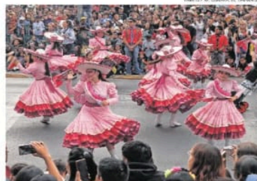
Cada grupo de bailarines o de músicos fue recibido con centenares de celulares, aplausos y gritos de los asistentes.