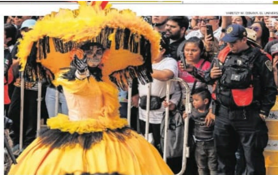
Hasta los policías que vigilaban el paso de las Carreras tomaron fotografías del evento.