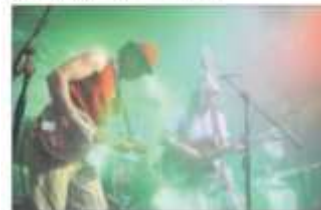
A. Su presentación en el polo marca 20 años de trayectoria.

“Estamos muy contentos de estar en México. Es una experiencia única para poder exponer nuestra música ante el público mexicano, así como mostrar nuestro talento de Chile que está cerca de Bolivia y Perú, donde se maneja mejor con nuestra música, por eso el objetivo de estar en México es grande y es un punto clave para alcanzar toda Latinoamérica, como una primera intención.”