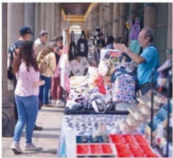
DIVERSION. Los asistentes disfrutaron de actividades culturales y un Bazar.

Con un recorrido teatralizado por el recinto, show de zancos, un mimo, presentaciones musicales, talleres y un Bazar Artesanal, así como la donación de alimento para los gatitos que viven en el Museo Panteón de San Fernando, el primer Festival Gatotitlán se llevó a cabo con éxito, destacó la Secretaría de Cultura local. El evento, que tuvo lugar este sábado, fue organizado en coordi-