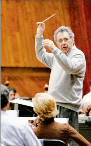
Enrique Bátiz Campbell, fundador de la Orquesta Sinfónica del Estado de México y la Orquesta Sinfónica de la Secretaría de Cultura de México.