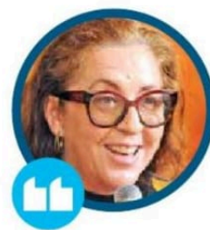
En el marco del 8M hicimos

Excelsior buscó si dicha actividad fue reportada previamente por la dependencia, pero no se detectó registro entre los comunicados de prensa que la secretaria emite diariamente.