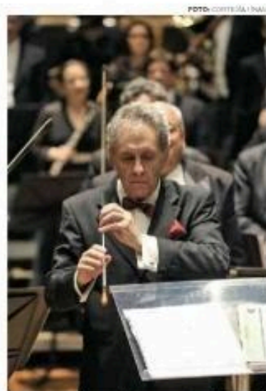
MAESTRO. Impulsó a decenas de músicos.

Y es que Enrique Bátiz fue un hombre de su tiempo, uno de los arquitectos fundamentales de la música orquestal en México, que ejerció con un temperamento celebrado por muchos, pero cuestionado por otros. Por más de seis décadas impulsó la música clásica en el