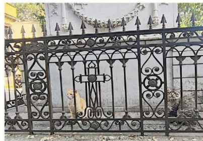
El 22 de febrero se llevará a cabo una colecta de alimentos para gatos, además de recorridos guiados.