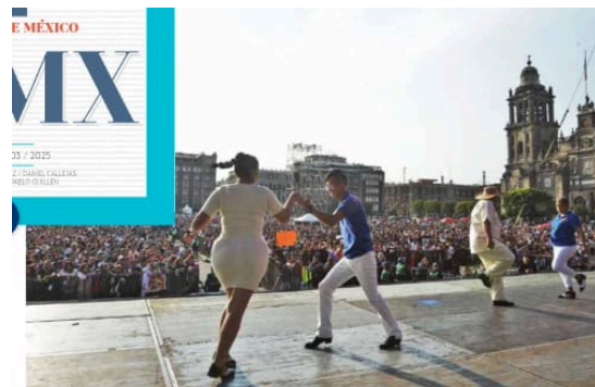
• A RASPAR. La plancha del Zócalo capitalino recibió la tercera edición del Gran Baile de Sonideras y Sonideros.