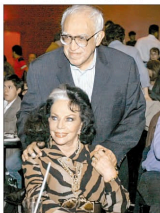
El escritor Carlos Monsiváis durante el homenaje por sus 70 años junto a Tongolele , en 2008.

En años recientes, participó en el teatro musical Perfume de gardenia y, en mayo de 2012, celebró sus 65 años de trayectoria con la obra Tongolele . El espíritu de una época en este mismo recinto teatral del Centro Histórico.