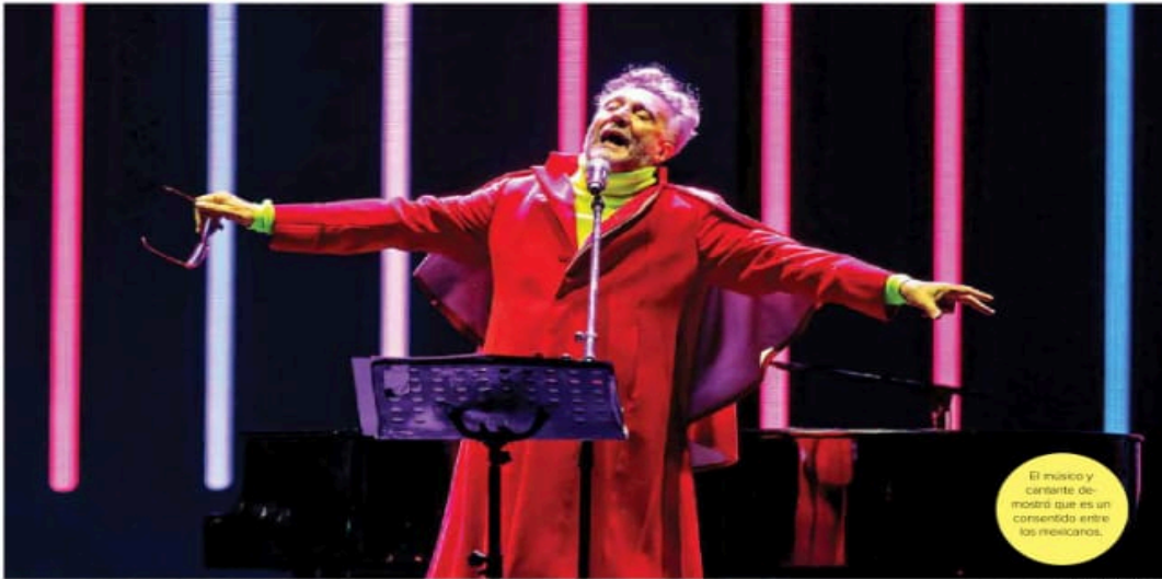
El músico y cantante demostró que es un consensado entre los mexicanos.