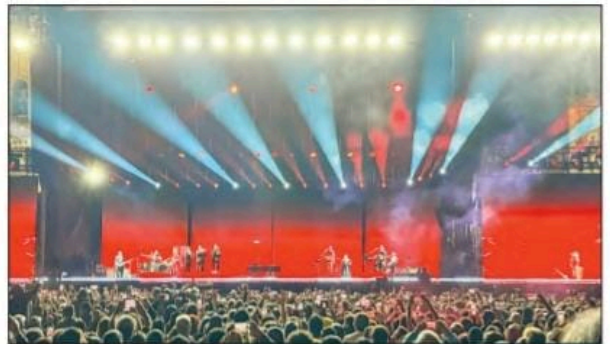
El cantautor salió al escenario con un atuendo rojo característico de su gira El amor después del amor .

Asisten 80 mil a presentación en el Zócalo pospuesta desde septiembre