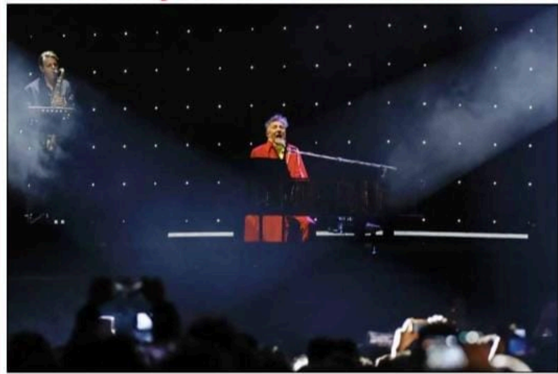
▲ El cantante, compositor, escritor y cineasta argentino, uno de los iconos del rock en español, saldó anoche su deuda con el público mexicano tras haber pospuesto su concierto en septiembre pasado