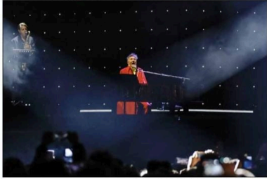
El cantante, compositor, escritor y cineasta argentino, uno de los iconos del rock en español, saldó anoche su deuda con el público mexicano tras haber pospuesto su concierto en septiembre pasado por un accidente doméstico. La guía fue su espectáculo El amor después del amor de la gira de 2024, que conquistó a más de 80 mil espectadores. ÁNGEL VARGAS / P 27