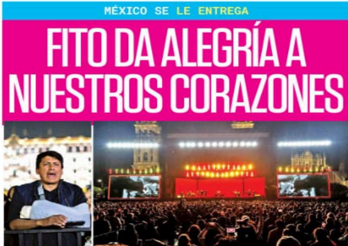
La gente disfrutó el recital del artista de Rosario, Argentina, en una noche barquileña con saldo blanco.

“¿Qué tal ahí, eh? ¡Qué hermosa! Vamos a cantar”, lanzó el originario de la provincia de Rosario, Argentina, para darle paso a una de las canciones más icónicas de su repertorio. El sí llegó al Zócalo en la voz de su autor sólo para que el público fuera quien verdaderamente la cantara... todo bajo la supervisión, y sonrisa, de Fito. “Se la saben cantar”, apuntó.