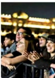
En su mayoría fueron adultos los que se reunieron para ver a Páez, quien pospuso de septiembre a enero su show de anoche.

No hay manera que la música de Páez no refleje su entorno y sus experiencias de vida, un ejemplo de esto es Yo vengo a ofrecer mi corazón , canción que fue publicada en 1985 en el disco Grosy y con la cual hace un manifiesto contra la injusticia y una muestra de solidaridad... después de que sus abuelas fueran asesinadas. Con este tema al argentino tocó no sólo su piano, sino el corazón y la conciencia social, aunque fuera por un momento, de los presentes. Fito ya no es ese chamalero que luchaba en los 80 para adueñarse de un espacio en la escena nacional e internacional del rock en español, ahora es un músico consagrado y reconocido que