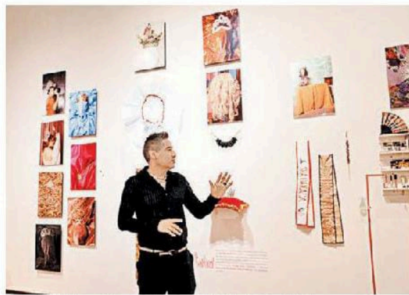
La exhibición está en el Museo de la Ciudad de México. ESPECIAL

Su trabajo es exquisito porque le dio presencia a quienes no la tenían en una época oscura de censura neoliberal y porque ha combinado, desde siempre, los sociales con lo erótico, lo pop, lo antropológico y lo kitsch.