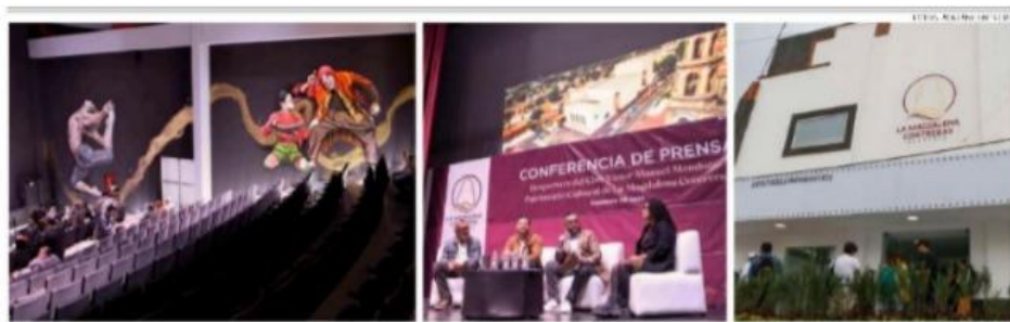
Rebren sus puertas el "Piojito", que fue inaugurado en 1930.

CRÓNICA, MIÉRCOLES 12 FEBRERO 2025 | Metrópoli | 13