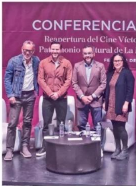
CULTURA. El espacio dedicado al séptimo arte, se convierte en una herramienta para combatir la ruptura del tejido social.