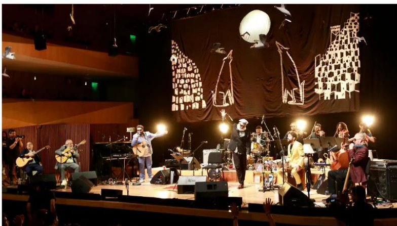
Macha y El Bloque Depresivo presenta su show "Tu Felicidad es la Mía"

La agrupación chilena regresará a la CDMX con su combinación de ritmos latinos, luego de estrenar un álbum grabado en El Cantoral