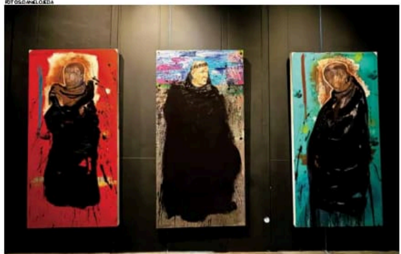
• MEMORIA. Cada uno de ellos fue fundamental en el proceso de evangelización en la Conquista.