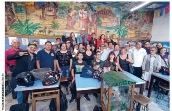
REPRESENTANTES DE varias pulquerías capitalinas, agrupados como Resistencia Pulquera, durante un encuentro, ayer, en La Paloma Azul.

El pasado 28 de marzo el director general del Invea, Jorge Esquinca Monta-