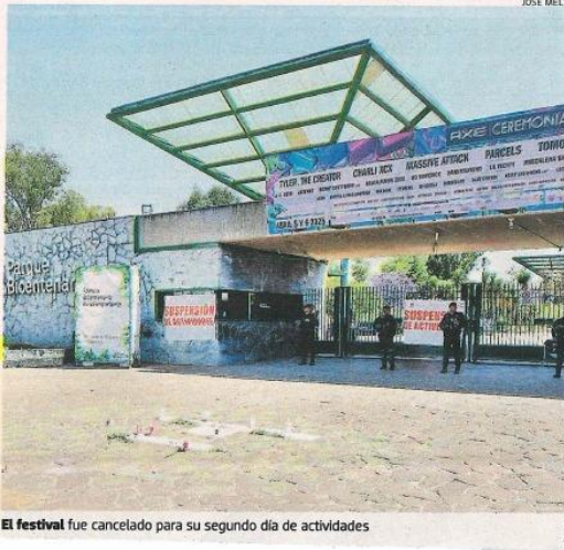
El festival fue cancelado para su segundo día de actividades

Este lamentable hecho no puede repetirse. Por ello, hemos decidido implementar un sistema de control más estricto