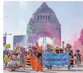
En el Monumento a la Revolución se dieron cita las comparsas de diferentes alcaldías.