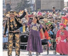
La jefa de Gobierno, Clara Brugada, afirmó que los pueblos originarios “llevan años resistiendo”.

Las 74 comparsas desfilaron del Monumento a la Revolución al Zócalo, en medio de baile, música y trajes multicolor