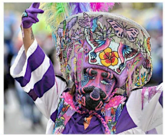
Más de 4 mil 500 artistas y 74 comparsas recorrieron una parte de Paseo de la Reforma, hasta llegar al Zócalo.