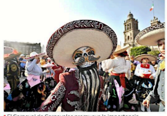
El Carnaval de Carnavales promueve la importancia de las tradiciones de los pueblos originarios.