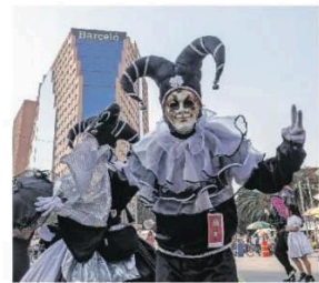
Entre colores y vestuarios llamativos los contingentes marcharon durante una hora y media para llegar al Zócalo.