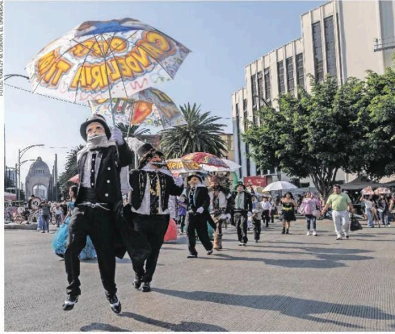
En 2024 el Gobierno de la Ciudad de México consideró a los carnavales como Patrimonio Cultural Inmaterial; son eventos que enamoran y llenan de alegría a los habitantes.

En febrero de 2024, el Gobierno de la Ciudad de México declaró los carnavales como Patrimonio Cultural Inmaterial, pues se trata de una tradición cuyos orígenes se remontan al siglo XVI, además son una muestra de la interacción de las sociedades europeas e indígenas en la época colonial. ●