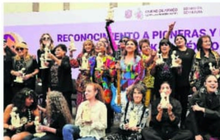
En el Museo de la Ciudad de México, la jefa de Gobierno, Clara Brugada, entregó reconocimientos a 44 exponentes del rock.

“Señora Presidenta, señora jefa de Gobierno, exigimos un cese a la violencia y más protección para todas nosotras”, expresaron las cantantes de la banda Bloody Benders durante su presentación, marcando el tono feminista y de protesta que conservaría el concierto, que inició a las 18:00