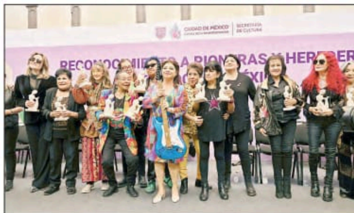
▲ En el concierto Sirenas al ataque se presentaron en el Monumento a la Revolución la banda Las Luz y Fuerza y Baby Bätz, entre otras. A mediodía, la jefa de Gobierno Clara Brugada entregó reconocimientos a las pioneras de este género musical.