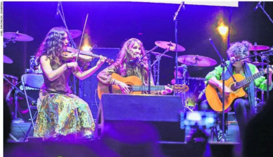
En la explanada del Monumento a la Revolución se homenajeó a las pioneras del rock mexicano, así como a representantes del año 2000.