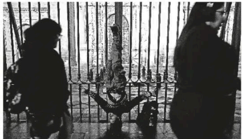
MEXICAN WOMEN PHOTOGRAPHERS

A partir de hoy, el Museo de la Ciudad de México muestra el trabajo de fotoperiodistas que exploran la street photography